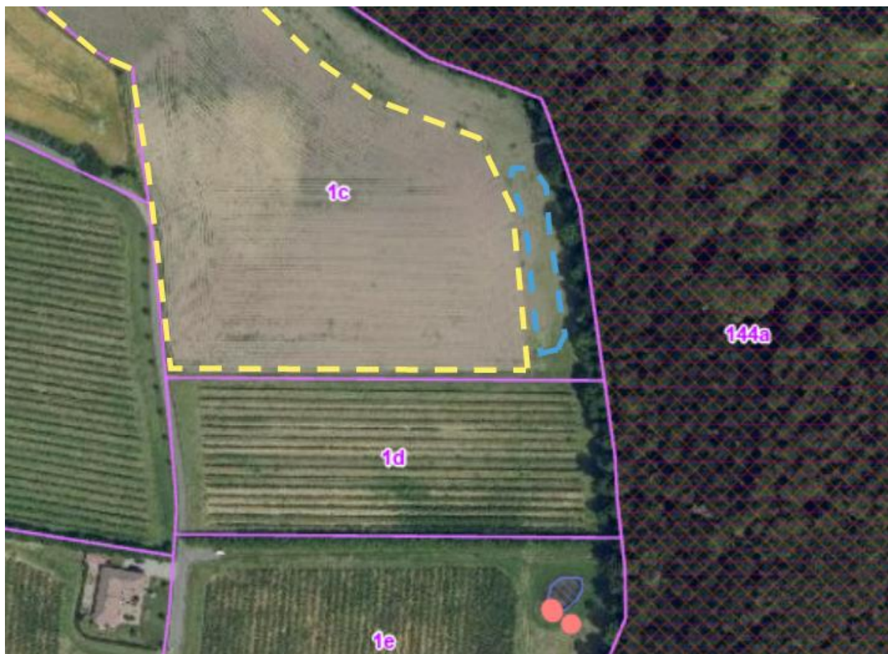
Kortbilag 1: Luftfoto Sommer 2022. §3-beskyttet natur er markeret med blå polygon (sø), og Natura 2000-område Lillebælt er markeret med brunt gitter. Placering af ny sø er markeret med blå stiplede linje, pink prikker er bilag IV-arter (løvfroe og stor vandsalamander), og gul stiplede linje er godkendt skovrejsningsprojekt fra 2022 på samme matrikel.