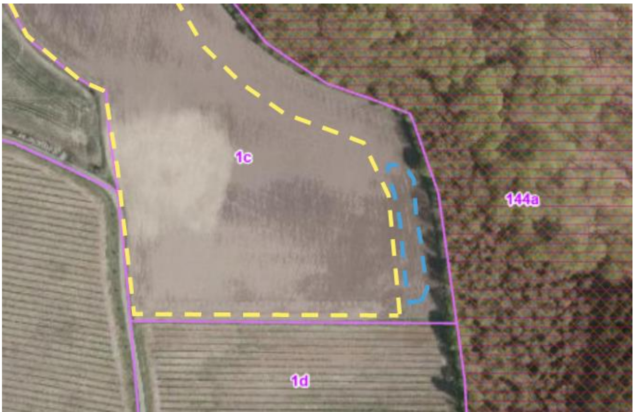
Kortbilag 3: Luftfoto Forår 2018. Af kortet fremgår det, at der på projektområdet er vådt.